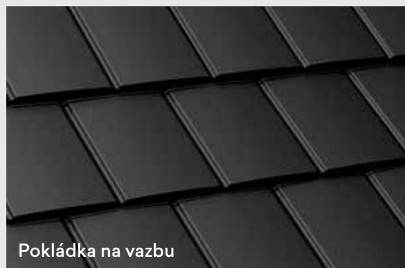
Pokládka na vazbu

Tašky Isola Powertekk Plano lze pokládat dvěma různými způsoby. Na střih a na vazbu.